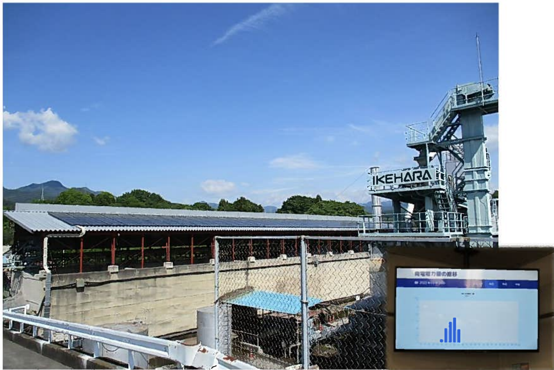
東橋工場内 発電電力自家消費型ソーラーパネル