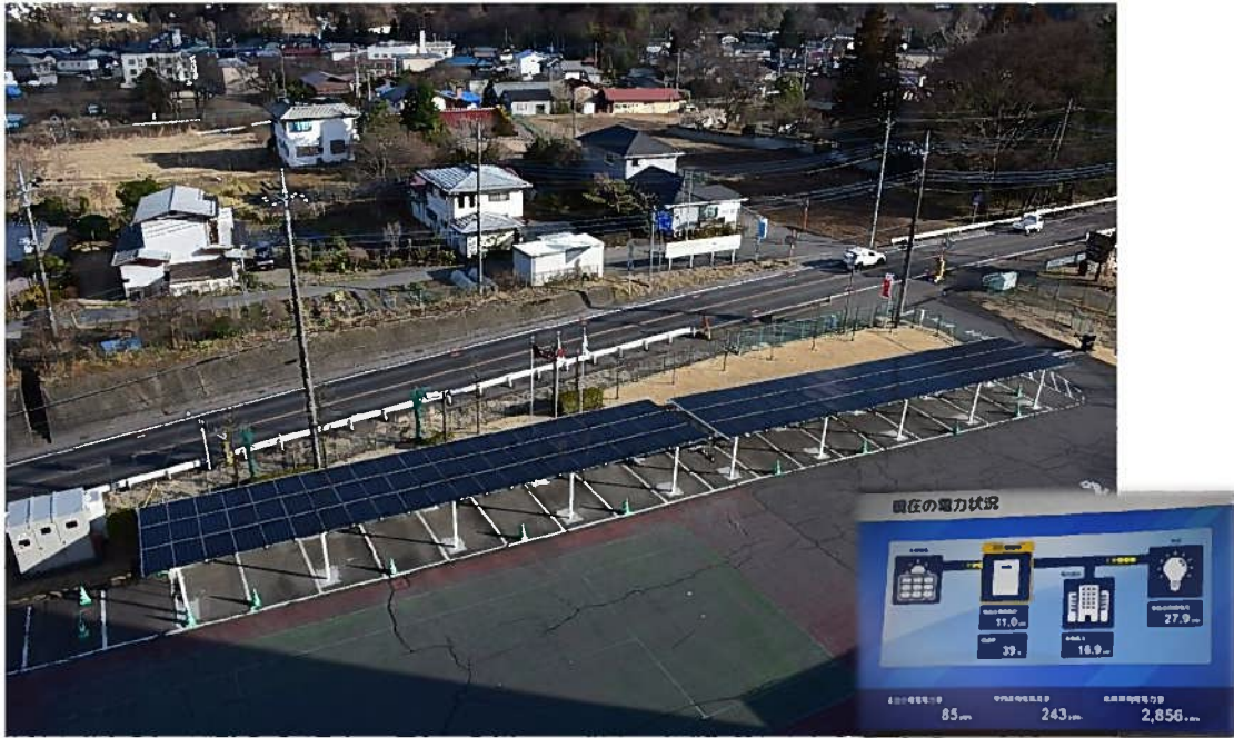
本社内 発電電力自家消費型ソーラーパネル